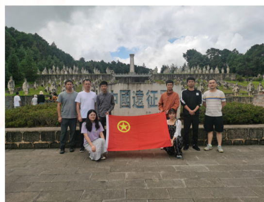
(金厂河公司 茶雪芝)

为传承和弘扬抗战精神,激励中华民族在实现中华民族伟大复兴中国梦的征程上奋勇前进,监理公司党支部组织,带领公司党员团员青年一行来到松山战役遗址参观学习。松山战役遗址是目前保存最为完好的二战战场遗址之一,这次参观学习,使党员、团员青年进一步了解党史、国史;坚定理想信念,弘扬爱国主义精神;通过坚守入党初心,践行党员服务宗旨,提升党性修养,持续发挥党员同志的先锋模范作用。